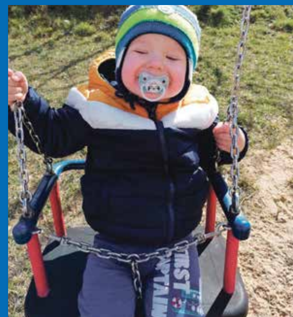
Wiktorek (2 latka) z Przysieki Polskiej