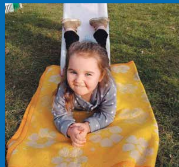
Lena (4 lata) ze Starego Bojanowa